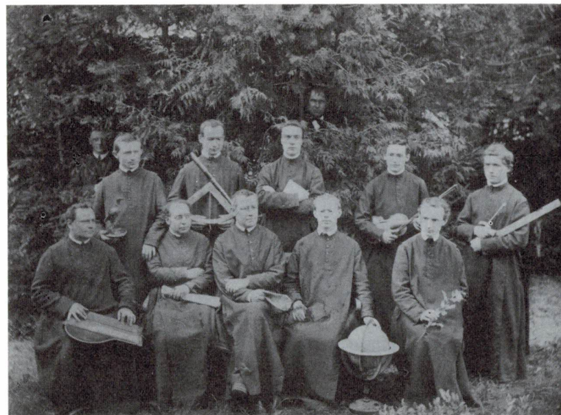
Der klösterliche Lehrkörper 1872. Der einzelne trägt wie ein Attribut das Zeichen seines Haupt- oder Lieblingsfaches in den Händen.

Hier eine Erklärung zum Begriff «Benediktinerkollegium» im Titel. Das «Kollegium», wie es immer genannt wurde, war seit seinem Bestehen im Jahre 1752 eine kantonale Schule, auch wenn sie auf ein Testament